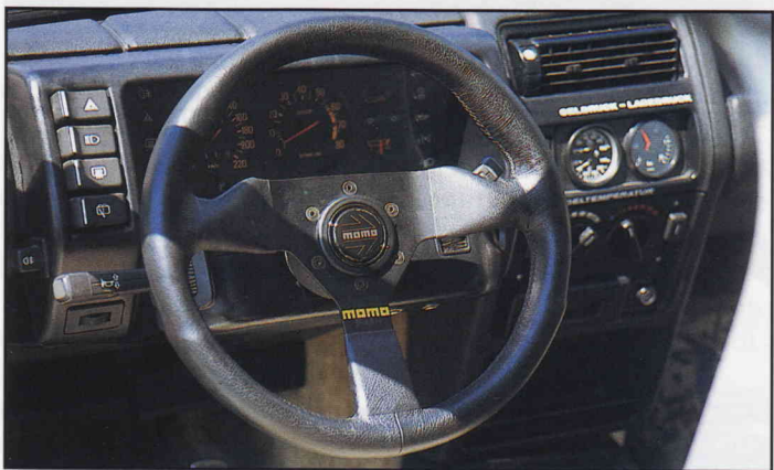
Alles fest im Griff mit dem Ledervolant.

zu seinem Renault gratulieren, da es nicht mehr allzu viele gute von diesen Rennern gibt.