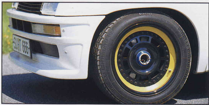
Keine Show, sondern echt – der Zentralverschluss.